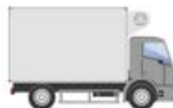
REFRIGERADO CARGA SECA